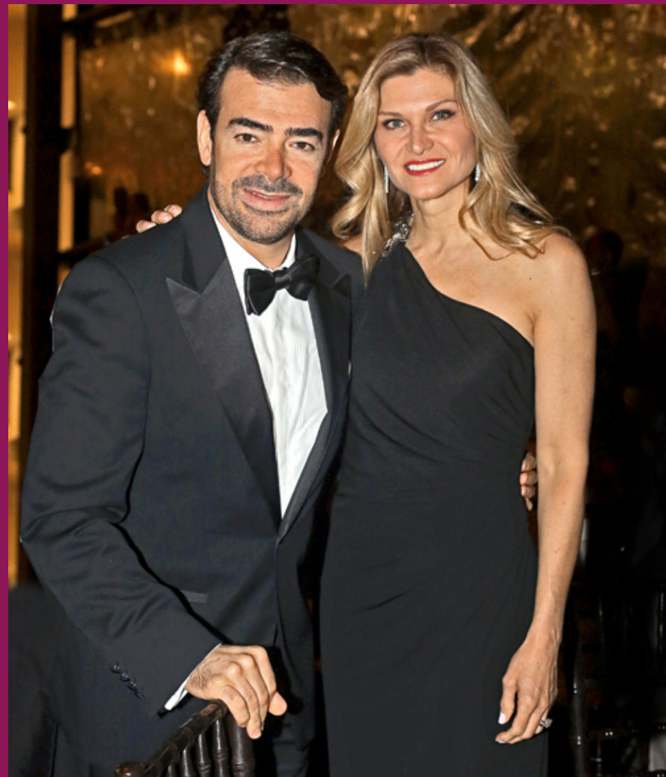
Toño Mauri y Carla Alemán